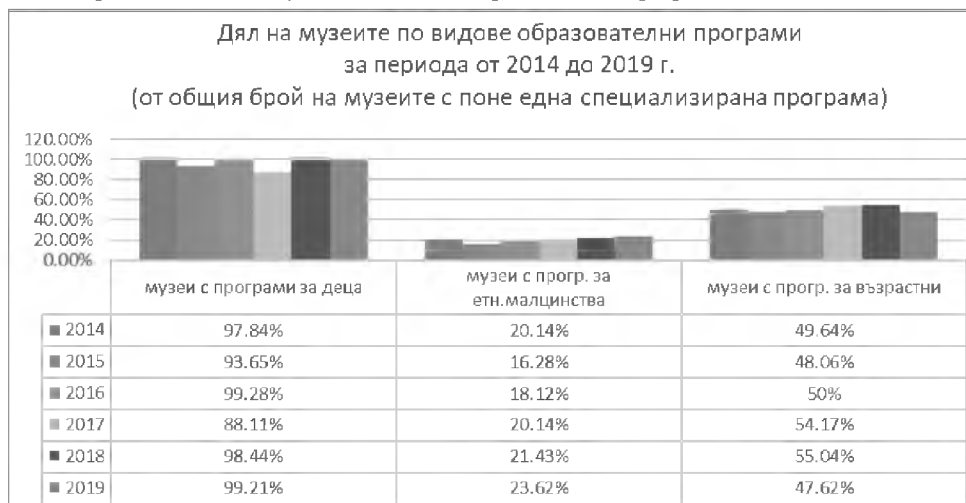
Диаграма № 1. Дял на музеите по видове образователни програми